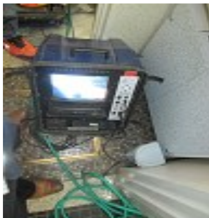
トイレの排水管にカメラを入れて詰まりの調査をしましたよ