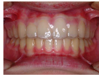
上顎のみ保定装置